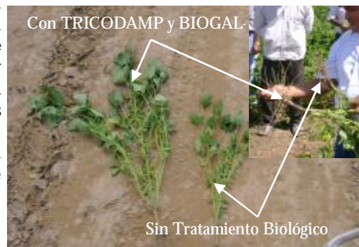
Soya Uirapurú, misma semana y zona de siembra

Siembro Soya. Ahorita tengo ... 32 hectáreas, hace dos campañas uso el TRICODAMP, ahorita la soya bien responde, hay más engruesamiento ... es también bueno, bueno es, y el costo es más barato, el resultado es bueno ... hay más enraizamiento, las plantas más buenas, más macollage. Poca enfermedad hay en las plantas, no se secan como las anteriores. Está llegando ahorita a los cuarenta días. Hay diferencia, éste [TRICODAMP] más acelera la germinación en cambio el otro no.