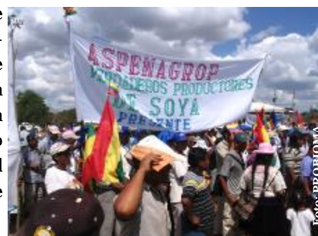
1er Encuentro del TCP, Villa Paraíso, San Julián