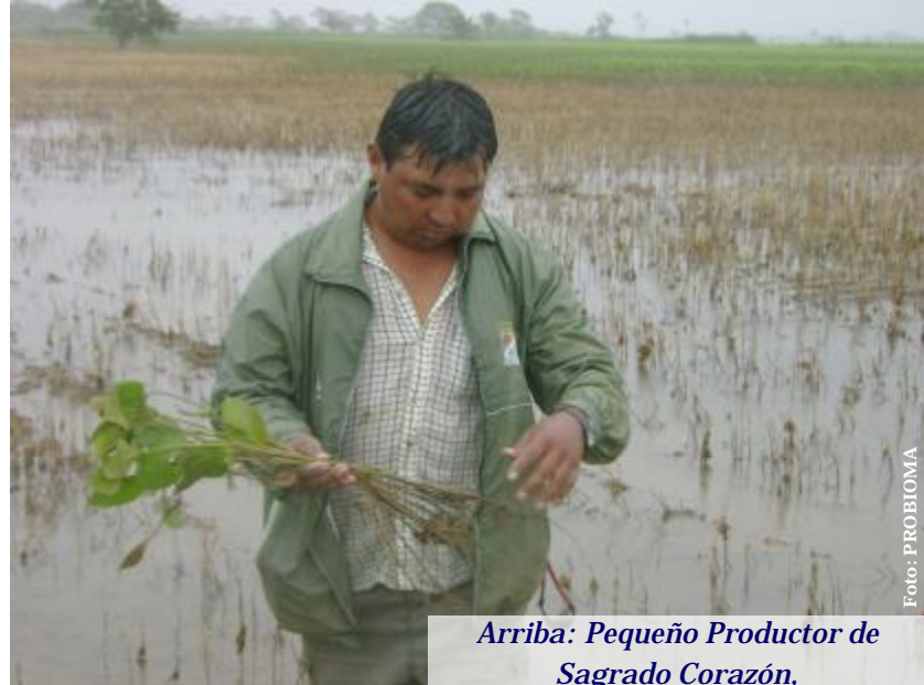
Arriba: Pequeño Productor de Sagrado Corazón,

Si bien el fenómeno de “El Niño” fue el causante de este desastre, debemos mencionar que los daños podrían haber sido