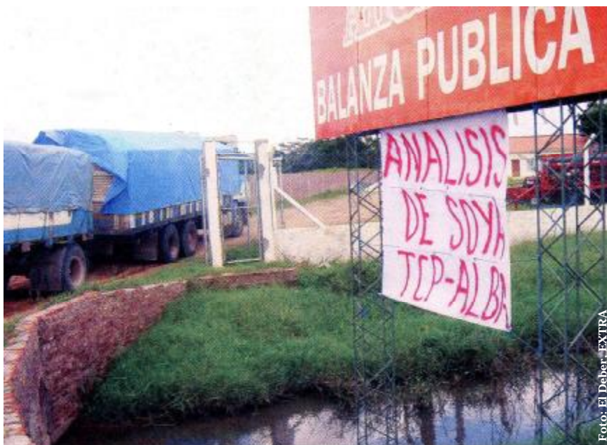
Entrada al Centro de Análisis, Montero

El Tratado de Comercio de los Pueblos firmado en primera instancia por Venezuela, Cuba, Bolivia y que actualmente también, es conformado por Nicaragua, ya cumplió su primer año. La visión del TCP, según autoridades nacionales, es de "promover en cada departamento núcleos productivos de desarrollo a partir de la inversión de proyectos de alto impacto, permitiendo que los medios e instrumentos de producción sean de propiedad para los productores y campesinos de áreas urbanas y rurales". *