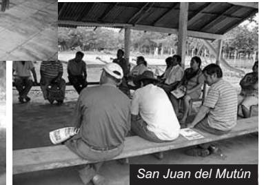
San Juan del Mutún

Una de las preocupaciones comunes se refiere a la falta de información sobre la presencia de proyectos mineros en la zona. Ésta debiera ser transmitida por las autoridades nacionales, departamentales y municipales; recordemos que la Nueva Constitución Política del Estado en su Art. 349 establece que los recursos naturales son propiedad y dominio del pueblo boliviano, y que el Estado debe administrarlos en función del interés colectivo , por ello está obligado a mantener informada a la población sobre cualquier proyecto que involucre el manejo de sus recursos naturales, para que éstas puedan decidir al respecto.