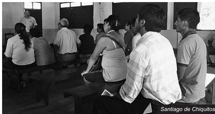
Santiago de Chiquitos

Sin tomar en cuenta el gran valor de esta importante Reserva Departamental, dentro de ella, el gobierno ha otorgado concesiones mineras a empresas extractivista, y como siempre, los últimos en enterarse son los pobladores locales. En tal sentido se llevo a cabo el taller con autoridades y pobladores de Santiago de Chiquitos para