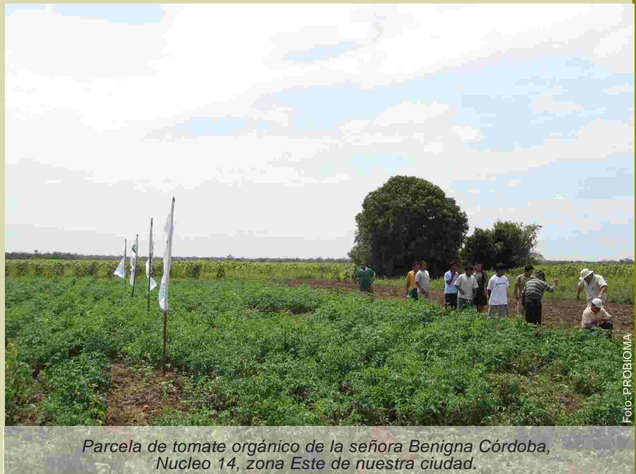
Parcela de tomate orgánico de la señora Benigna Córdoba, Núcleo 14, zona Este de nuestra ciudad.

Si hubiese utilizado químicos el costo hubiese sido de Bs. 900 y la utilidad sólo Bs. 700