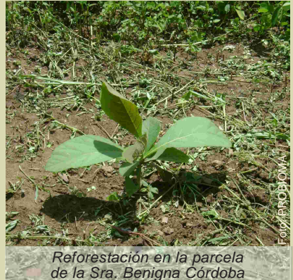
Reforestación en la parcela de la Sra. Benigna Córdoba