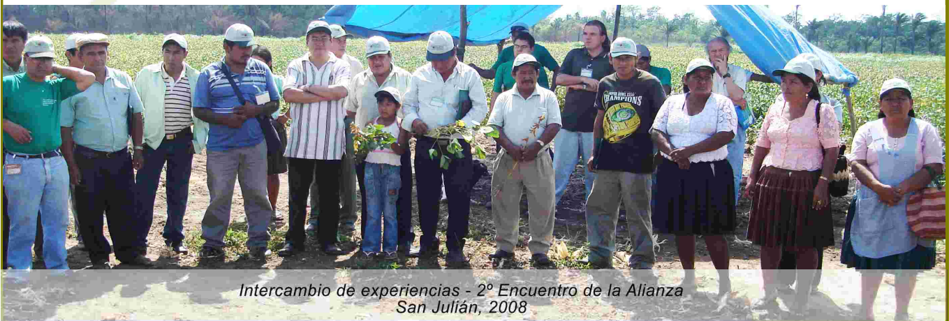
Intercambio de experiencias - 2° Encuentro de la Alianza San Julián, 2008

Estaremos con noticias de dicho evento en la próxima edición de "El Sojero Ecológico".