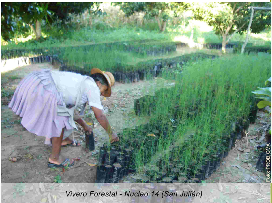
Vivero Forestal - Nucleo 14 (San Julián)

Esperamos poder incorporar a más grupos de mujeres a estas iniciativas durante la actual gestión.